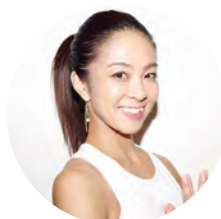
ヨガ インストラクター